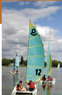
Plan d'eau Le Mêle-sur-Sarthe