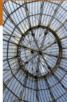
La Halle au blé Alençon