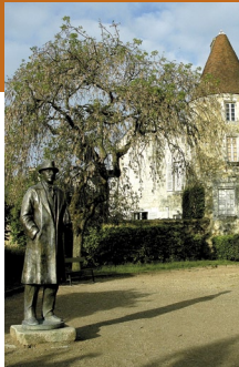
Musée "Mémorial Alain" Mortagne-au-Perche

Des petits groupes d'arbres (boqueteaux) annoncent la transition entre la forêt et de vastes champs pour s'ouvrir sur la plaine ondulante d'Alençon et son paysage urbain.